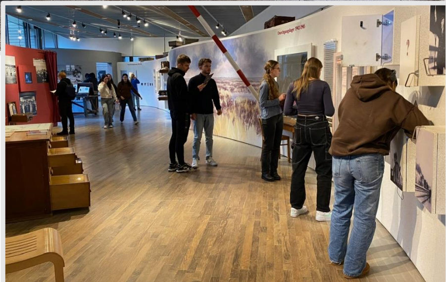
Rechts: Erkundung der Dauerausstellung im Herinneringscentrum Westerbork.