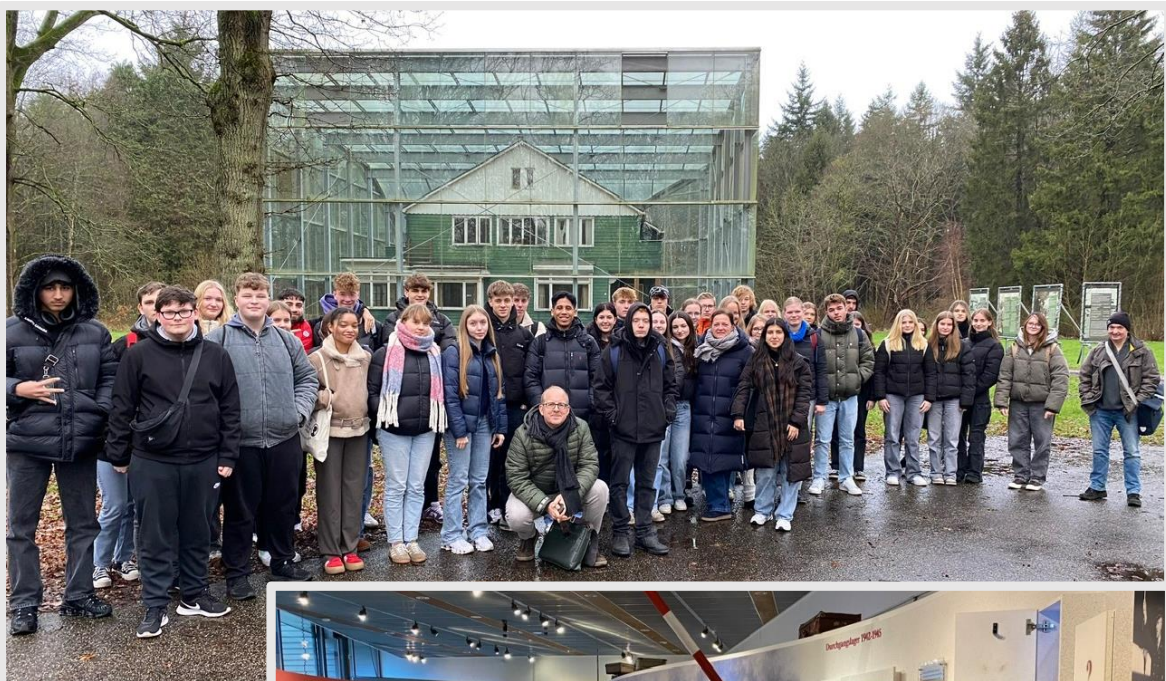
Oben: Die Exkursionsgruppe auf dem Gelände des ehemaligen Lagers Westerbork.